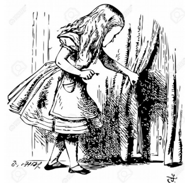
Alice au pays des merveilles. Illustration de John Tenniel, 1865

Mêlant absurde, bouffonnerie clownesque, poésie et conte fantastiquement réel, Déboussolés invite à revivifier un peu ce monde pixelisé. C'est un renouvellement du regard (fatigué, le regard!), une bonne claque à ce qui nous oppresse, un rayon lumineux bien envoyé pour balayer l'habitude. Qu'elle parte au galop. Faisons un grand écart de côté et explorons notre quotidien. Tout est tellement inconnu.